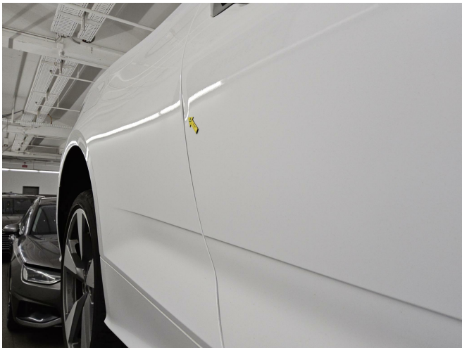
Bild 3: Außen, Tür vorne rechts - Türkante, beschädigt, instandsetzen und lackieren mit Lackaufbau