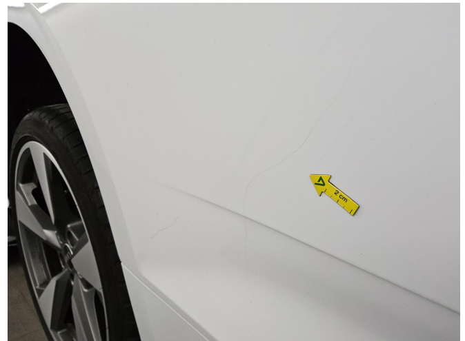
Bild 4: Außen, Seitenteil hinten rechts, Kratzer, lackieren mit Lackaufbau