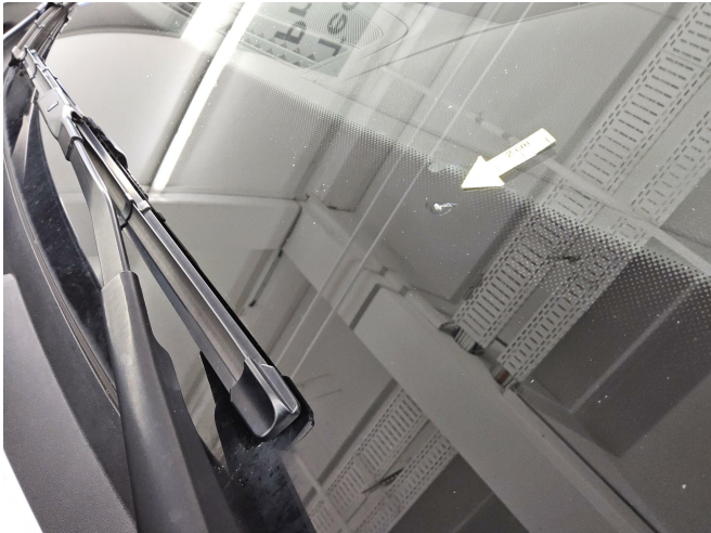
Bild 1: Außen, Frontscheibe, Steinschlag mit Rissbildung, außerhalb Sichtfeld (Randbereich) erneuern