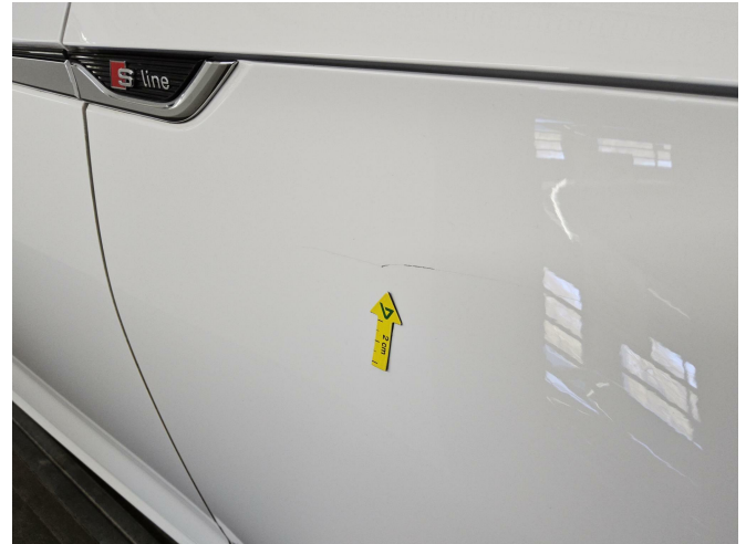
Bild 2: Außen, Kotflügel vorne rechts, Kratzer, lackieren mit Lackaufbau